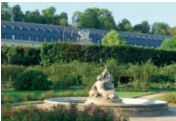
Square Carrier-Belleuse à Sèvres

La société prestataire de la collecte des ordures ménagères pour la communauté d'agglomération Val de Seine a changé. A partir du 1 er mars, ce sont désormais les camions de la société SEPUR qui collecteront les bacs à Sèvres et sur une partie de Boulogne-