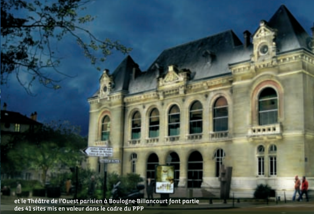
et le Théâtre de l'Ouest parisien à Boulogne-Billancourt font partie des 41 sites mis en valeur dans le cadre du PPP