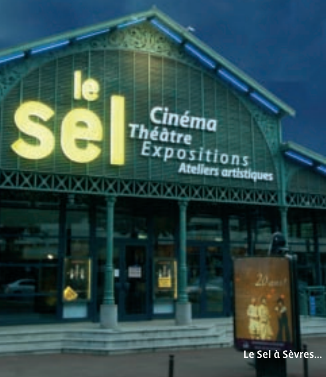
Le Sel à Sèvres...