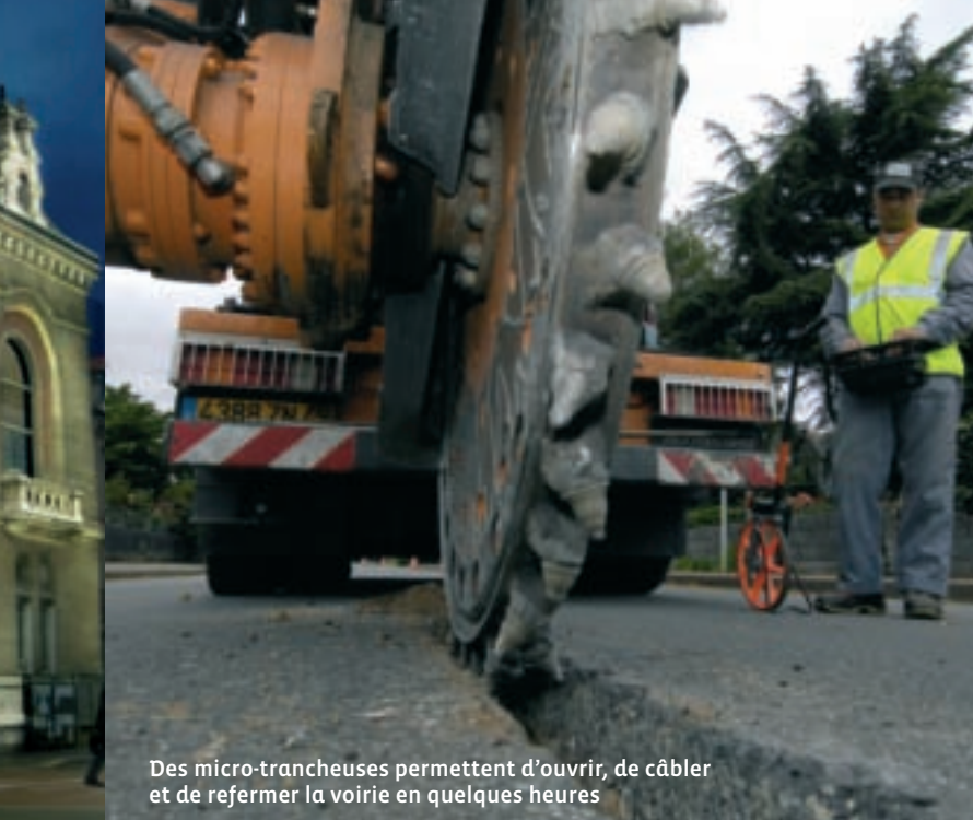
Des micro-trancheuses permettent d'ouvrir, de câbler et de refermer la voirie en quelques heures