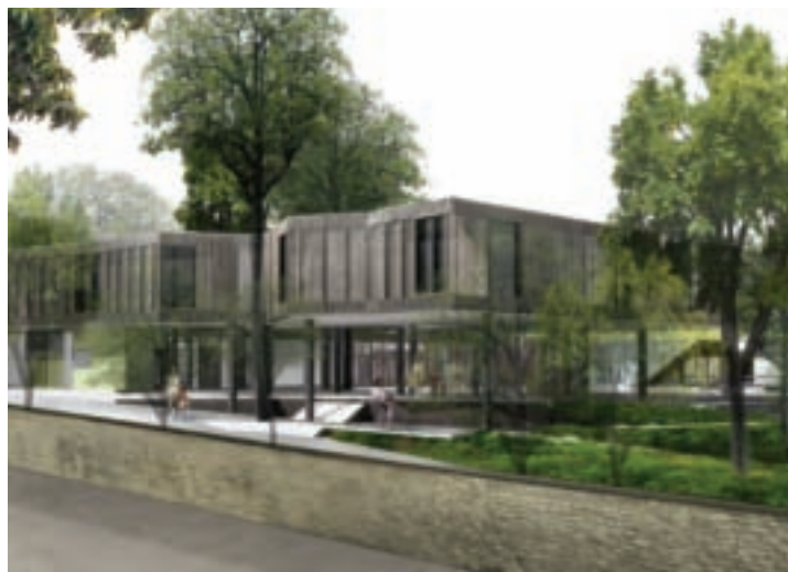
La reconstruction de l'école Croix Bosset est l'investissement majeur de 2009.